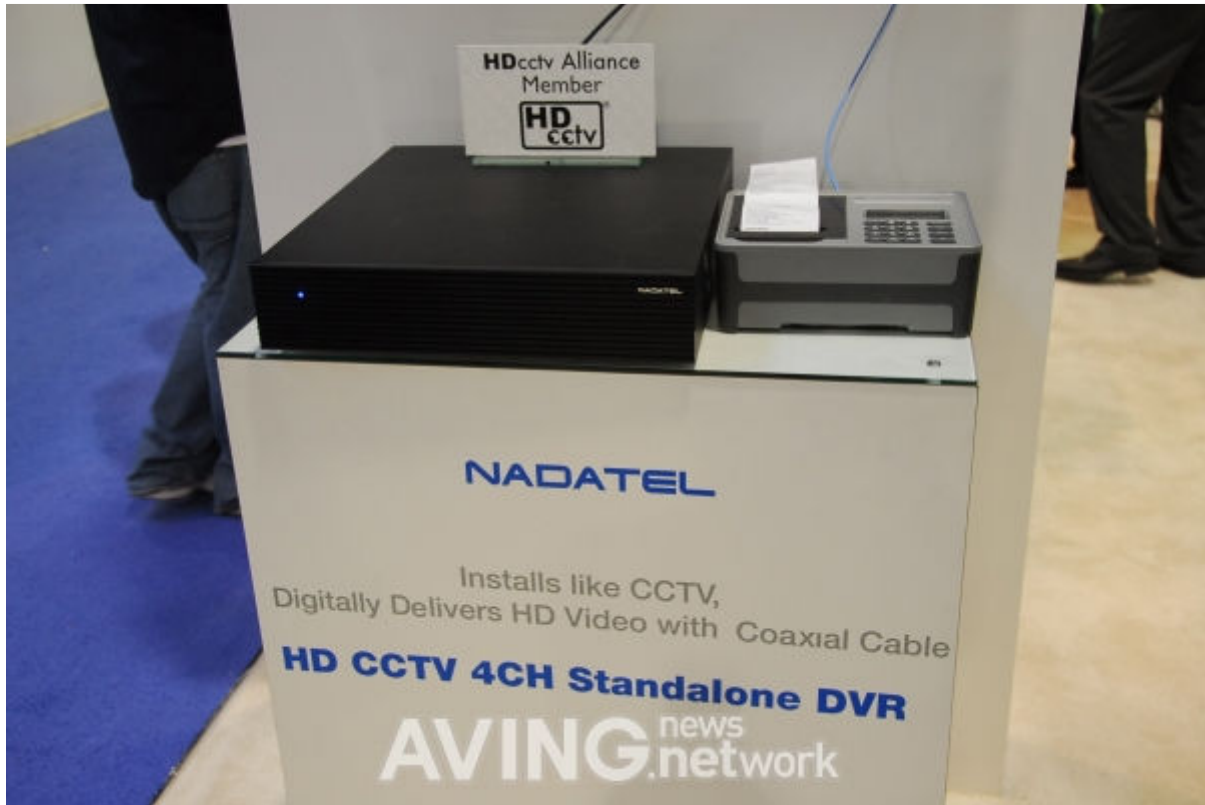
(사진설명: 나다텔의 'HD CCTV 4CH Standalone DVR')